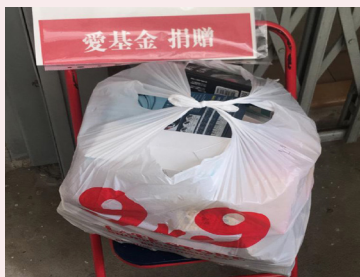
抗疫物資送到染疫者家。