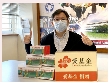
校長收到抗疫物資，代表有需要家庭感謝愛基金。

2022 年初疫情確診數字每日飆升，抗疫物資難求，愛基金購買了港幣 20 萬元的抗疫物資（包括快餐店餐券、快速測試套裝、蓮花清瘟膠囊、搓手液和面罩），趕急送到香港 20 多間學校和機構，分發給染疫的基層學生家庭、劏房戶和長者中心。希望於疫境中發揮獅子山下的精神，以愛同行，為社會出一點力、增添一點溫暖。