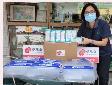
獲贈的團體均表示極大的謝意，感激愛基金雪中送炭。

支援 10 戶基層家庭提供疫情支援金，舒緩經濟困境，需要港幣 $30,000 元正。