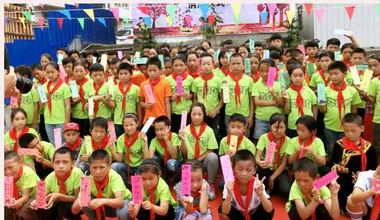
為大涼山 100 名小學生發助學金，免去孩子跋涉之苦，踏上文化之路。

為大涼山小學建太陽能熱水系統改善浴室設施，防止學生皮膚病互傳，建立良好衛生習慣。