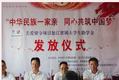
助怒江州累計近 200 名大學生走出大山，放飛夢想。