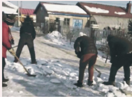
義工清理街上積雪。