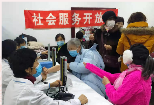
服務點舉辦義診活動。