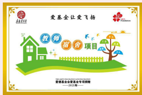
資建教師宿舍，讓老師有所安頓，更用心教學。