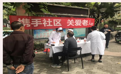
捐贈醫療車作流動義診及贈醫療費給無法支付的病人。