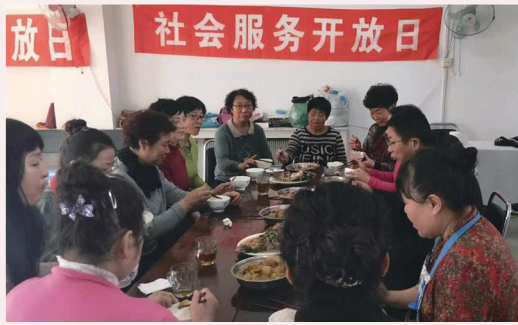
提供免費愛宴給貧困家庭，建立互愛。

各地「關愛留守服務點」在這兩年仍努力不懈走進人群，積極進行家訪、服務點開放日及物資捐贈的活動，把信望愛無條件地帶給有需要的人。