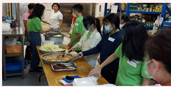
預備午餐派發給獨居長者