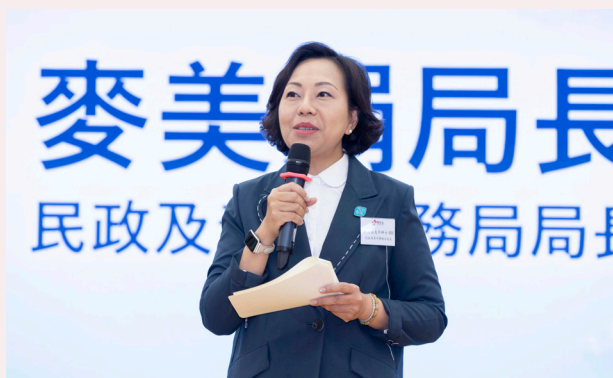
民政及青年事務局局长麥美娟女士勉訓學生

愛基金現與 20 間中學合作，獲校長推薦了數百位具良好品格，並願意接受栽培的學生參加。計劃將在三年內於優質品格培育、社會公民責任、國家及世界觀三個範疇中學習，亦會鼓勵同學於學校帶動正能量活動、參觀頂尖資訊科技公司、與知名人士及演藝人見面交流、與企業 CEO 對話，及到不同公司和機構參觀與交流等，擴闊他們的視野，學習生涯規劃。每年投入參與的學生將獲得獎狀及獎學金港幣 $3,000 元至 $5,000 元，按年遞增，以資鼓勵。由於參加這個計劃的學生有一半是來自基層家庭，資源相對缺乏，相信他們獲得獎學金後，學習資源可以得到提升。