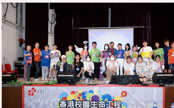
才藝表演 - 活出生命時裝表演

暑假期間最為精彩和緊湊的活動莫過於暑期領袖訓練營會。三百多位學生與生命導師，共同度過了3日2夜的難忘時光。通過團隊活動、音樂晚會、生命故事與見證分享、聖經話劇、才藝表演、社區探訪匯報及小組討論等多元活動，為參與者打造了豐富、多姿多彩的活動體驗及學習成長平台。同學們均表示透過此活動，獲益良多。