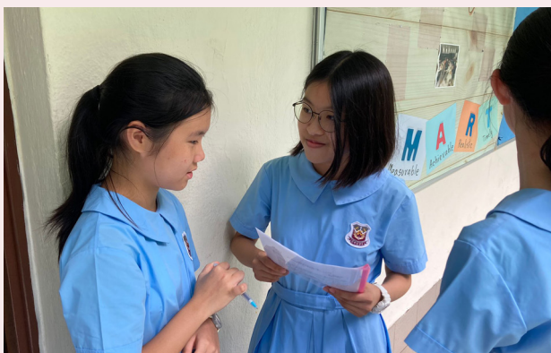
關懷中一學生，分享心靈小故事及送上小禮物