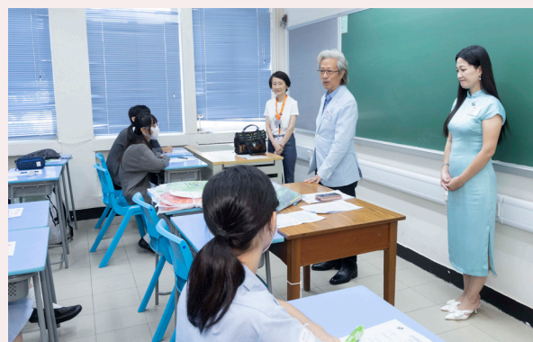
大企業主席與學生交流

計劃的開幕禮於 7 月 15 日舉行，有超過 500 位學生及家長，100 多位生命導師以及學校校長和老師參加，為計劃揭開序幕。愛基金更邀請到多位嘉賓和企業 CEO 與學生及家長交流，分享他們的奮鬥故事，亦以「成長之道：ABC + 3P」激勵學生。出席者均表示感激愛基金出心出力栽培香港未來的社會棟樑！