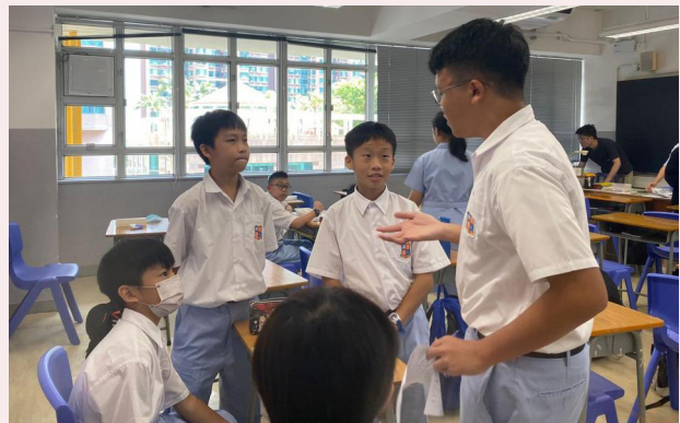
關心中一同學升中後的適應