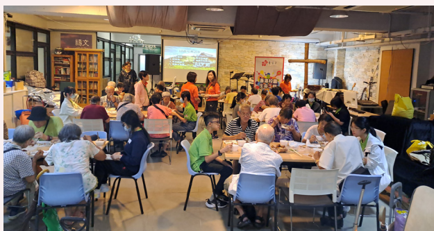
與獨居長者共進午餐